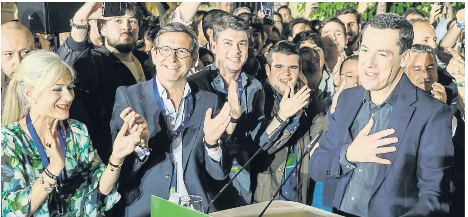
Juanma Moreno Bonilla agradeciendo anoche con la mano en el pecho las felicitaciones de sus seguidores tras su victoria electoral