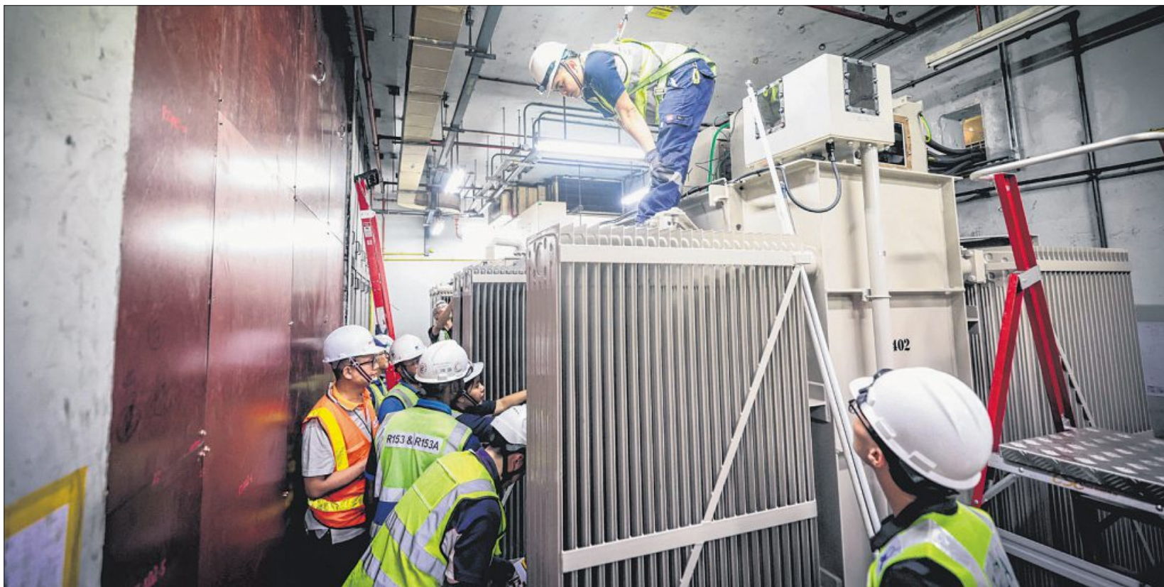
地铁可靠度工作小组建议，引入额外的备用系统或程序，一旦发生轻微故障，可绕过原有系统，让列车能更快恢复运作。图为工程人员今年10月在波东巴西站进行整流变压器的更新和测试工作。

除了优先更新列车、信号和电力这三个核心系统，工作小组建议运用科技和数据，在整个地铁网络实施更全面和标准化的状态监测，以便更及时地进行预防维护和更换关键部件。