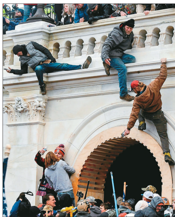
▲曾參與國會暴亂的人也可以申請反司法武器化基金，引起兩黨國會議員的反對。

華盛頓郵報分析，許多共和黨人同樣對基金深感不安，反彈聲浪甚至影響了為移民執法機構提供預算法案的進度。共和黨聯邦參