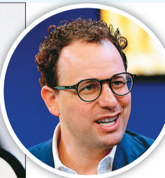
▲AI大廠Anthropic可能搶先對手OpenAI早一步IPO(左圖)，與SpaceX成為今年搶占資本市場最受矚目的三家公司。上圖為Anthropic執行長阿莫戴。

此外，馬斯克(Elon Musk)的SpaceX也計畫於今夏上市，目標估值高達1兆5000億元，