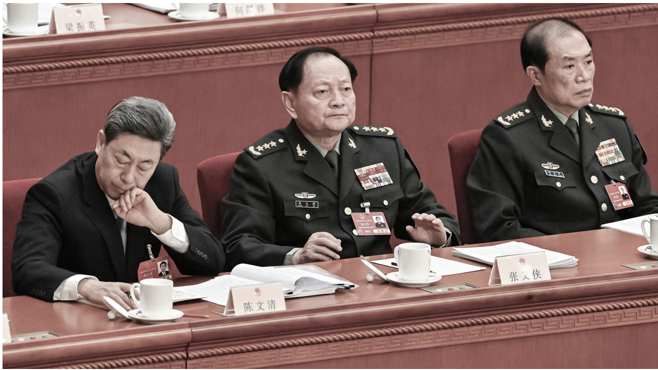
▲ 2025年3月5日，中央軍委兩名副主席張又俠（中）和何衛東（右）在中共人大開幕式上。如今兩人均已落馬。

自媒體「中國人事觀察」盤點，除了官宣落馬的上將外，還有23名上將被異常免職或處於「失蹤」狀態，缺席四中全會、晉升上將軍銜儀式等應該出席的場