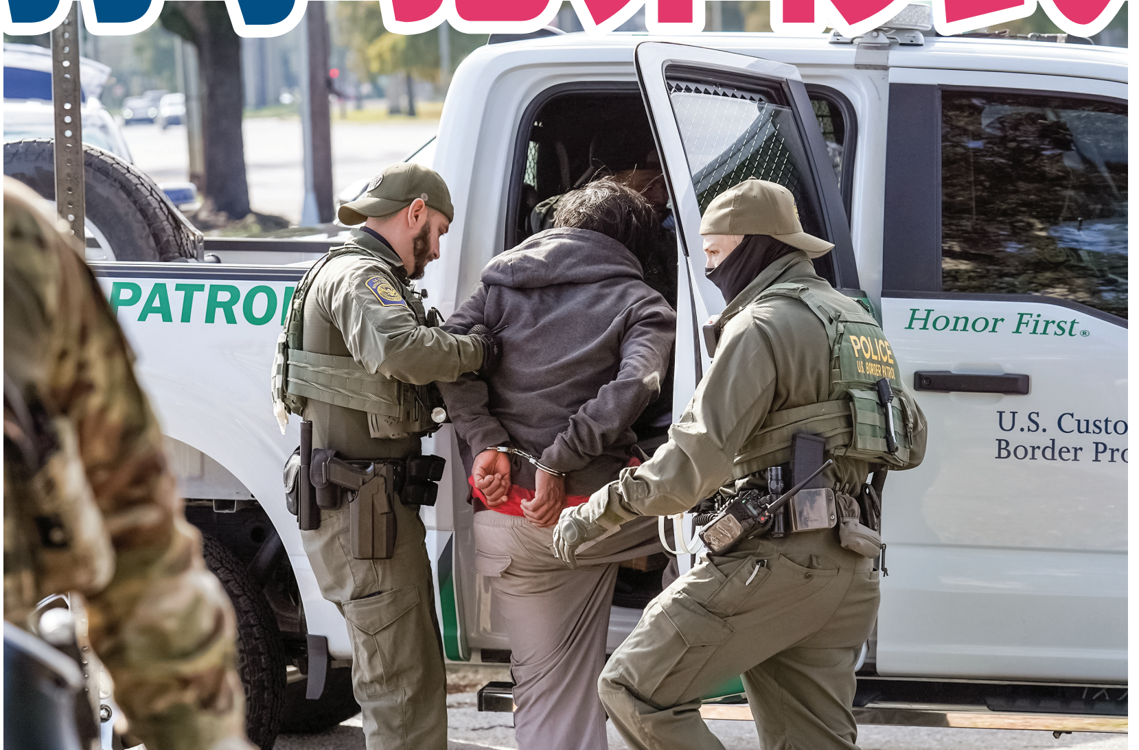
▲ 12月3日，邊境巡邏隊人員在新奧爾良街頭拘留一名男子。

將於2026年1月就職的民主黨籍當選市長海倫娜·莫雷諾 (Helena Moreno) 批評了新奧爾良及其它民主黨執政城市近期的加強