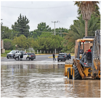
Los riesgos por inundaciones se incrementan en esta temporada de lluvias en la ciudad.

El Atlas también advierte que las acciones de mitigación deben complementarse con una adecuada planeación urbana para evitar que nuevos desarrollos habitacionales se establezcan en zonas de alto riesgo. Asimismo,