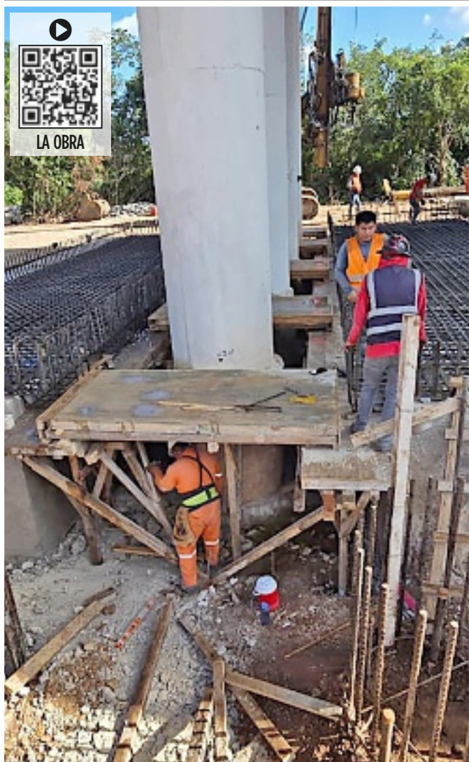
Trabajos de apuntalamiento intentan frenar el hundimiento de pilotes del Tren Maya.