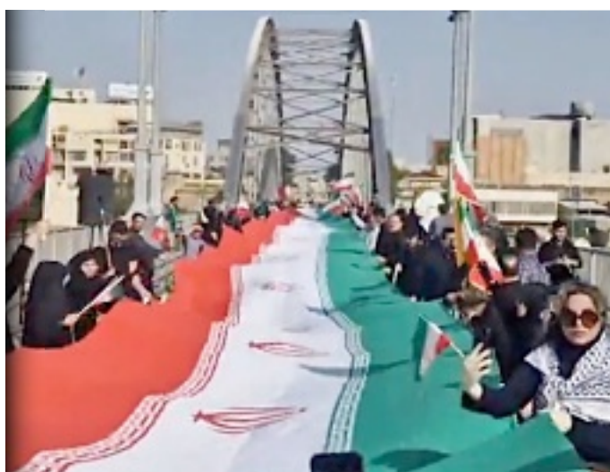
En Irán, cadenas y escudos humanos fueron desplegados el martes en centrales eléctricas y puentes en las horas previas a que se cumpliera el plazo de Trump para la destrucción masiva.