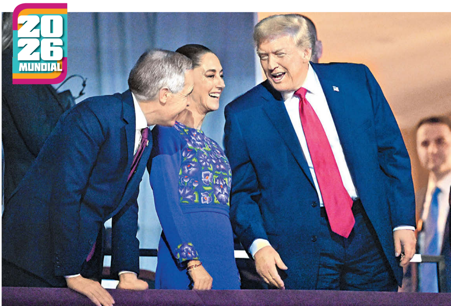
Los tres mandatarios en el palco de honor del Kennedy Center, donde el jefe de la Casa Blanca recibió el Premio FIFA de la Paz.

Arturo Pérez-Reverte Guerra Civil: atrocidades de los dos bandos P. 27