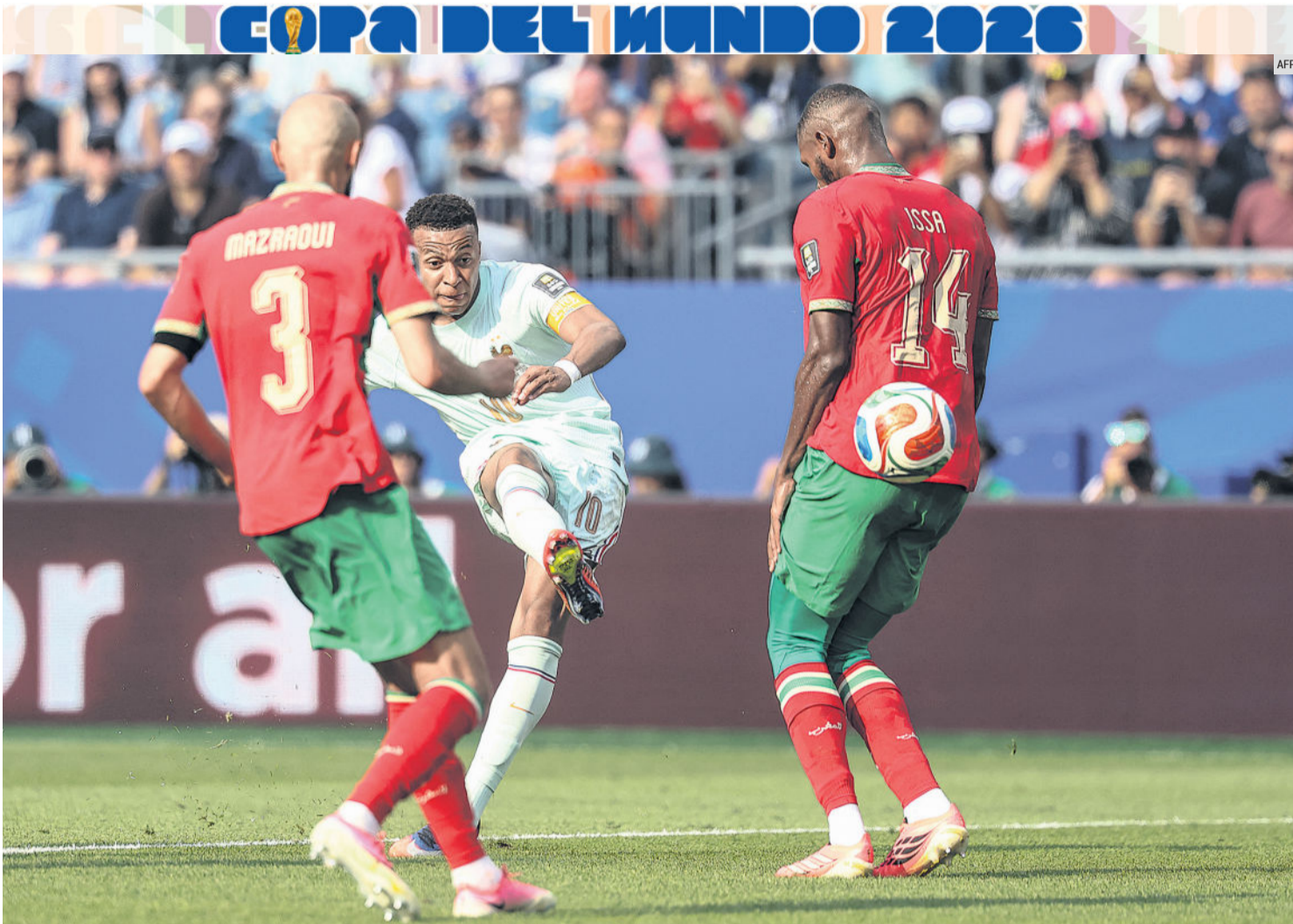
KYLIAN MBAPPÉ. El delantero francés dejó atrás el penal fallado y respondió como las grandes figuras: abrió el marcador con un potente disparo para firmar su octavo gol del Mundial, igualó a Messi en la lucha por la Bota de Oro y encaminó a Francia hacia su tercera Semifinal consecutiva de una Copa del Mundo.