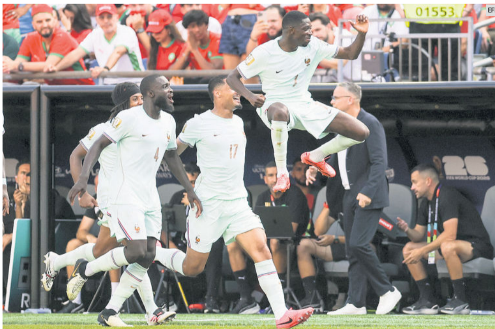
OUSMANE DEMBÉLÉ. El extremo francés (en el aire) selló la victoria con una definición precisa, tras una gran combinación con Mbappé.

Mbappé abandonó el terreno de juego al minuto 77 tras recibir un golpe en el tobillo derecho, aunque posteriormente descartó una lesión de gravedad.