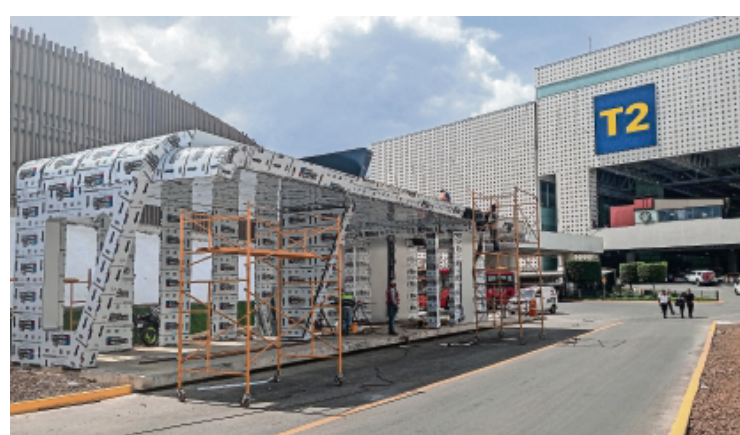
En la Terminal 2 del Aeropuerto Internacional Benito Juárez de la Ciudad de México aún se ven obras en proceso.