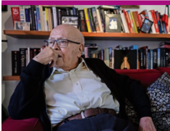
GABRIEL PANO, EL UNIVERSAL

Gerardo Estrada Tributo a un impulsor de instituciones