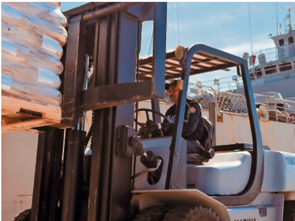
Bultos con ayuda humanitaria son cargados en buques en el puerto de Veracruz.

● El dato En 45 años, 19 países de AL han implementado 297 reformas, según la investigadora Flavia Freidenberg.