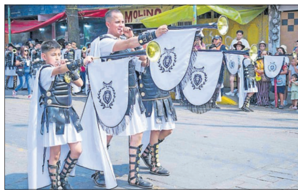
“Romanos” en el recorrido por los Ocho Barrios, el Jueves Santo, en la 183 Representación de la Pasión de Cristo en Iztapalapa