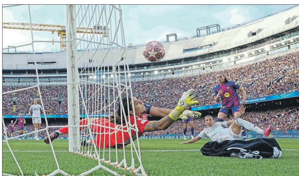
Apabullante. Ante más de 60 mil personas, el Barcelona goleó 6-0 al Real Madrid en el partido de vuelta de los cuartos de final en la Liga de Campeones femenil. Avanzó a las semifinales con un humillante global de 12-2 + MÁS INFORMACIÓN: DEPORTES

Fernando Bonilla no se colgó de la fama de sus padres cuando participó en la audición de “La oficina”, programa en el que encarna a Jero Peón.