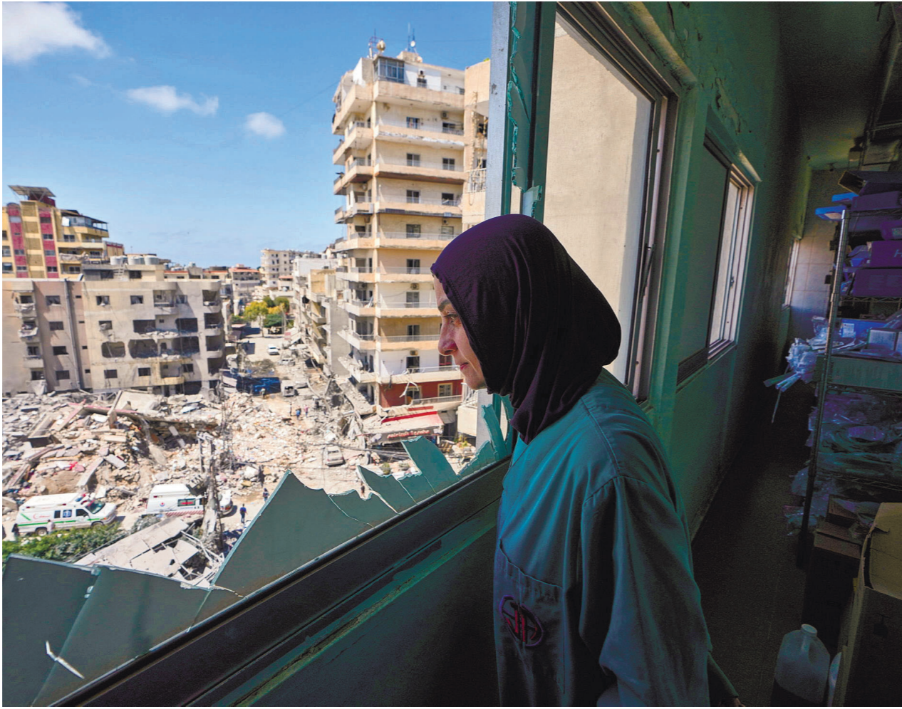
הריסות בבית חולים בעיר צור לאחר תקיפה ישראלית, אתמול. בלבנון דיווחו על שישה הרוגים