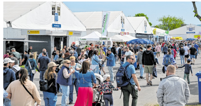
Viel los auf dem Freigelände und in Hallen des Maimarktes.