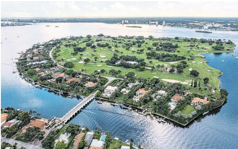
INDIAN CREEK es una comunidad aislada de Miami Beach, hogar de Jeff Bezos, Ivanka Trump y Julio Iglesias, entre otros.