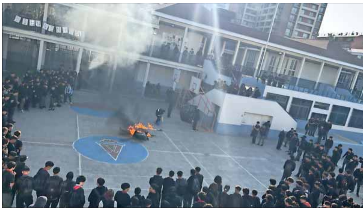
Los encapuchados que actuaron en el Liceo José Victorino Lastarria de Providencia prendieron fuego a una oficina de la inspectoría y a un basurero. Desplegaron un lienzo en el que se leía: "29M: Ni perdón ni olvido hacia el Estado asesino".

Ejecutivo presentará un proyecto al Congreso para "agravar las penas respecto de cualquier hecho delictivo" cometido al interior de un establecimiento educacional.