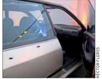
Seis dueños, 150 mil kilómetros y las huellas del atentado restauradas: el largo recorrido del auto de Jaime Guzmán, exhibido en la muestra "Chile no olvida". | C 6

Presidente Kast sostiene que usará atribución del indulto, pero que luego modificará el mecanismo | C 4