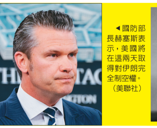
國防部長赫塞斯表示，美國將在這兩天取得對伊朗完全制空權。