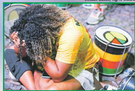
Torcedora chora a derrota no Pelourinho

O Brasil deu adeus, ontem, à Copa do Mundo, sepultando de uma vez o sonho do hexa neste ano ao ser eliminado pela Noruega por 2 a 1, nas oitavas de final, em Nova Jersey. Com o resultado, a Seleção pentacampeã vai chegar ao maior tempo longe do título mundial desde a primeira conquista em 1958. Os gols do centroavante Erling Haaland representaram um fracasso histórico de uma geração de jogadores, liderada por Neymar, que ontem chegou a diminuir, de pênalti, nos acréscimos. O talento de Vinícius Júnior não foi capaz de compensar a sucessão de erros da seleção comandada por Carlo Ancelotti. B1/B2