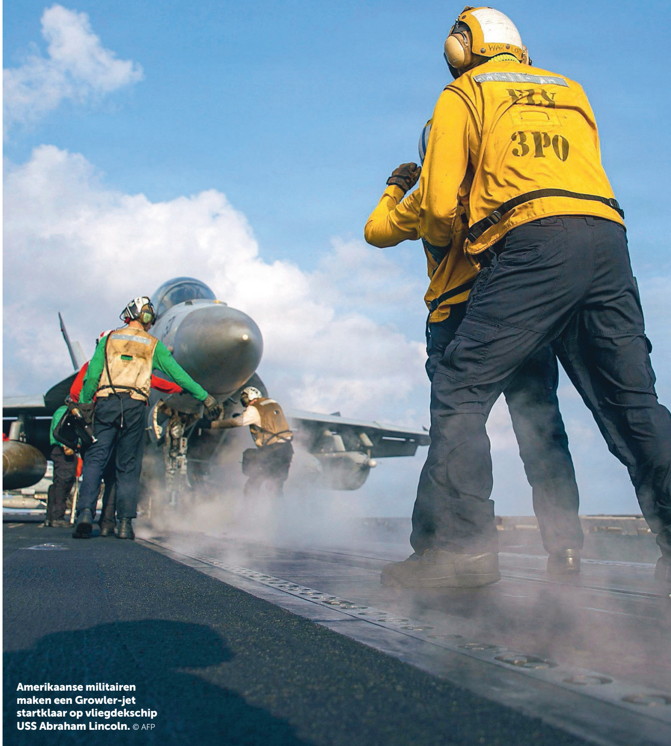
Amerikaanse militairen maken een Growler-jet startklaar op vliegdekschip USS Abraham Lincoln.